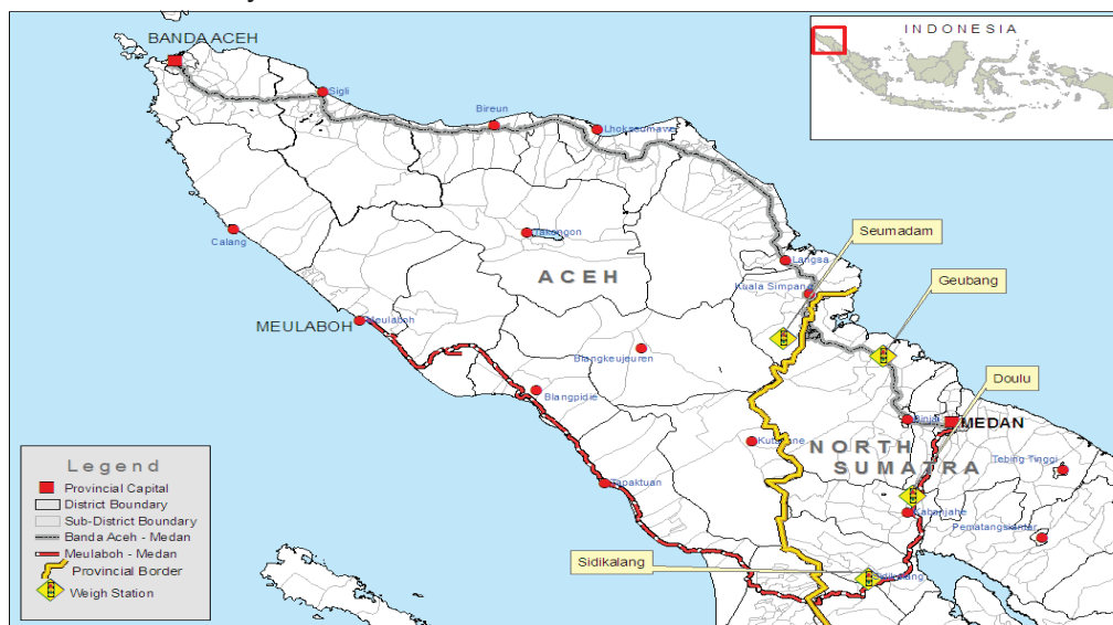
Gambar 1: Rute Perjalanan Truk ke dan dari Aceh

membayar suap kepada pejabat yang menangani pengangkutan propinsi di pos penimbangan. Jumlah pembayaran yang ditarik pada akhir tahun 2005 dan pertengahan pertama tahun 2006 cukup besar: studi C&D yang diringkas dalam tulisan ini menemukan bahwa, rata-rata, pembayaran pungli mencapai hingga 13 persen dari biaya pengoperasian sebuah truk setiap perjalanan, lebih dari jumlah upah yang diterima oleh supir truk dan kenek (asisten sopir) nya.