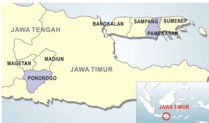
Peta 1: Lokasi Penelitian di Jawa Timur