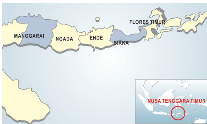
Peta 2: Lokasi Penelitian di NTT

faktor yang menjelaskan hal ini. Pertama, karena program PPK timbul dari sebuah proses di mana komunitas masyarakat menentukan sendiri kebutuhannya, dan kecil kemungkinan kebutuhan tersebut terbentur dengan prioritas lokal dan karenanya konflik pun terkendali. Kedua, tingkat kesuksesan penyelesaian konflik dari problem yang terkait PPK sangat tinggi, karena program memiliki sumber kekuatan mekanisme internal (dalam hal orang dan prosedur) sehingga membuat setiap ketegangan yang muncul sewaktu-waktu dapat diatasi.